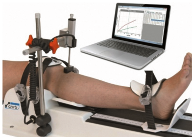
• Figure 2. Laximétrie dynamique automatisée.